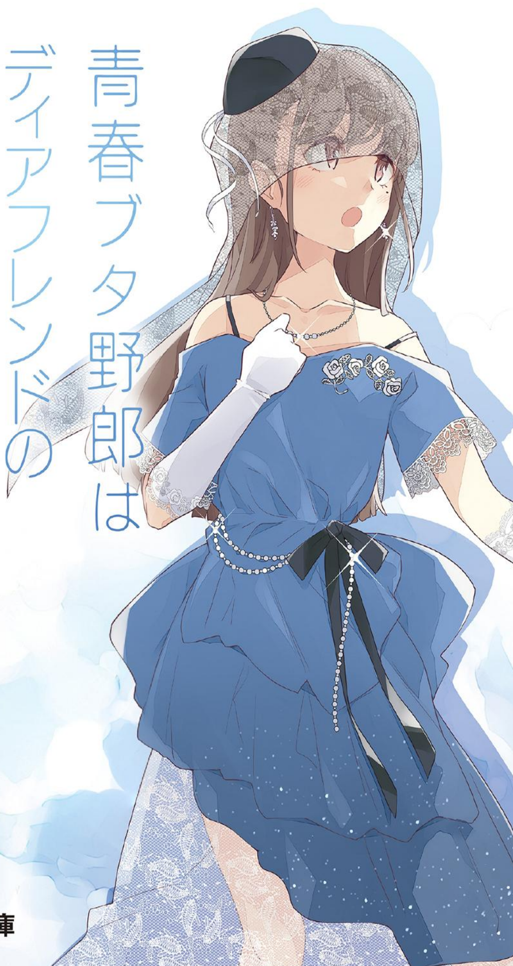
イラスト ● 溝口ケージ